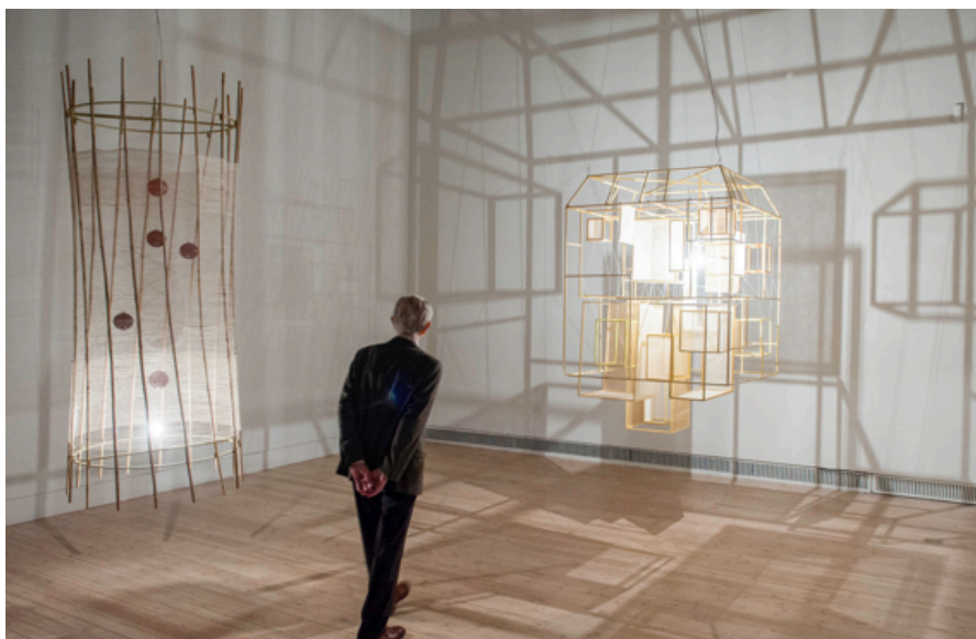
Kirstine Roepstorff, Spiel der Throne, 2013 (pohled do instalace v Staatliche Museen Berlin)

Výstava volně navazuje na projekt Metafyzika kázně , který byl v létě 2013 představen v galerii Českého centra v Berlíně. V Praze budou vystaveny zejména objekty, site-specific instalace i konceptuální projekty, které tematizují světlo a stín jako metafory současného zájmu o vztah hmatatelné a nehmotné reality z adorujících i kritických či ironizujících pohledů.